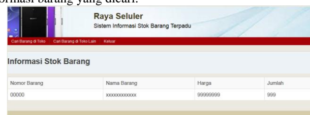
Gambar 7. Rancangan form informasi stok barang dari toko lain.

Setelah itu maka akan tampil informasi barang yang dicari.