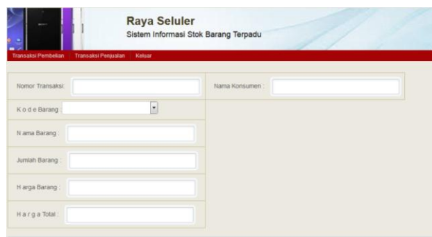
Gambar 5 Rancangan form transaksi penjualan barang