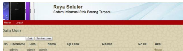
Gambar 3. Rancangan Form user admin