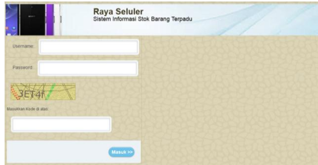
Gambar 2. Rancangan Form Login

Untuk rancangan form login, untuk semua user sama.