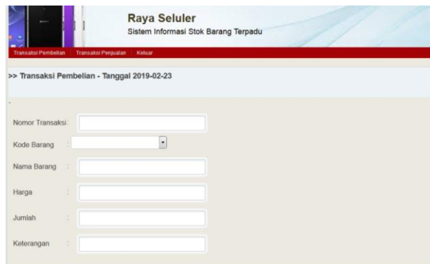
Gambar 4. Rancangan form transaksi pembelian barang